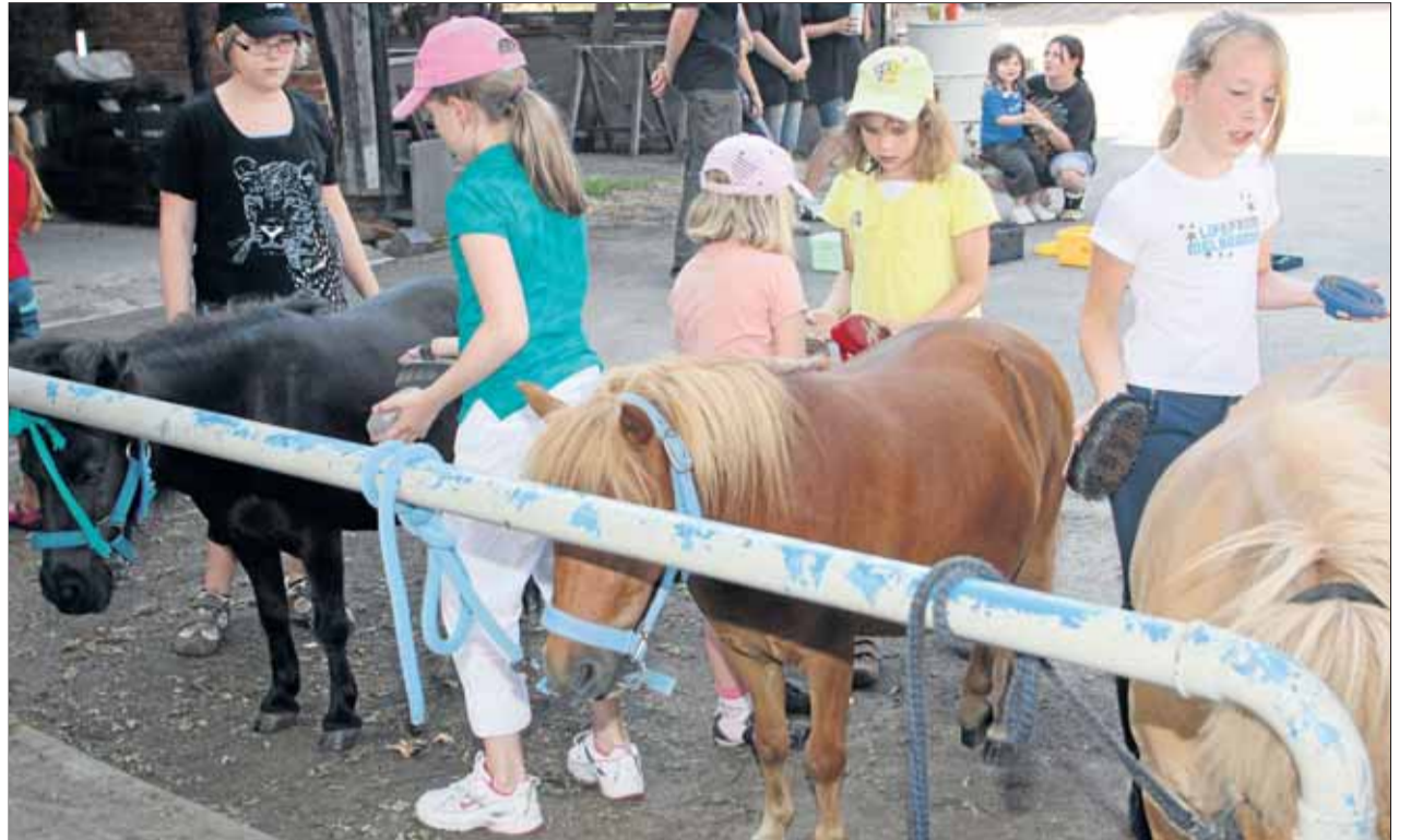
Mit Begeisterung bei der Sache: Die Ferienpasskinder beim Putzen und Striegeln der Shetland-Ponys in Hahndorf.

Die Freude an den Tieren ist bei den kleinen Teilnehmern deutlich zu spüren. „Ich finde es wirklich